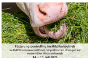
Fütterungscontrolling im Milchkuhbetrieb in 46499 Hamminkeln (Wesel) mit praktischen Übungen auf einem 850er Milchviehbetrieb 14.-15. Juli 2026

Im praktischen Teil des AVA-Workshops „besuchen“ und „evaluieren“ die Teilnehmenden einen großen Milchviehbetrieb, um mittels Checklisten das „Gelernte und Geübte“ direkt in der Praxis „anzuwenden“. Diese Controllingübungen finden auf einem 800er Milchviehbetrieb mit einem Herdendurchschnitt von über 12.000 KG Milch/Jahr. „Eine spannende Angelegenheit“!